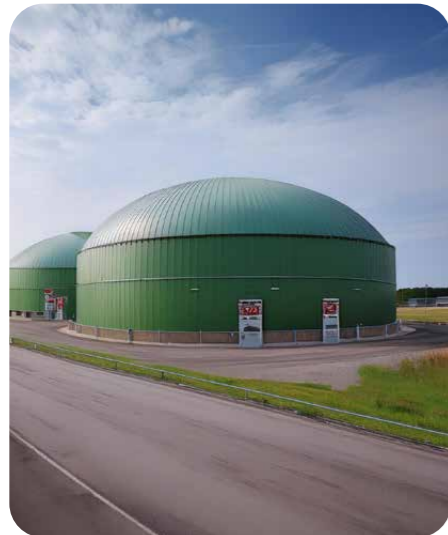
La méthanisation de nos biodéchets permet de fabriquer un carburant écologique et local.

Nos déchets alimentaires transformés en compost contribuent à enrichir nos sols. Ils servent aussi à produire une énergie renouvelable, le BioGNV, qui alimentera la majorité de notre flotte de bennes de collecte dès cette année.