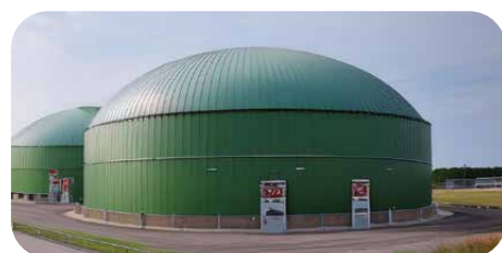
La méthanisation de nos biodéchets permet de fabriquer un carburant écologique et local.

Nos déchets alimentaires transformés en compost contribuent à enrichir nos sols. Ils servent aussi à produire une énergie renouvelable, le BioGNV, qui alimentera la majorité de notre flotte de bennes de collecte dès cette année.